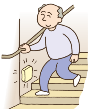
フットライトをつけるのもおすすめ！100円ショップで、両面テープで設置できるタイプもあるので、手軽に取り入れられます！

吹きかけてから使う といったことがあります。家電を扱うときにもちよつとした注意が必要ですね。 歳を重ねるとふとした勘違いから危険な状態に陥ることも。たとえば ●リモコンの操作を誤り、夏に暖房をつけて熱中症になってしまふ可能性も否めないの、表示の大きなリモコ