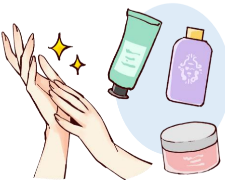
水仕事や手洗い、消毒で手肌の乾燥も気になりますね、ハンドクリームを指先までしっかり塗って保湿をしましょう。

腕は手先から二の腕に向かって丁寧に塗りましょう。足はリンパの流れを意識して足先から太ももに向かって塗ります。皮脂腺や汗腺が少なく、乾燥しやすいひじ、ひざ、かかとは尿素入りクリームを使うとなめらかなお肌が目指せます。ひじやひざは手足を曲げて円を描くように伸ばすとシワの間にもクリームが行き渡ります。ボディオイルもおすすめて、手になじませてから使用を。入浴後に、濡れたまま使えるタイプもあります。