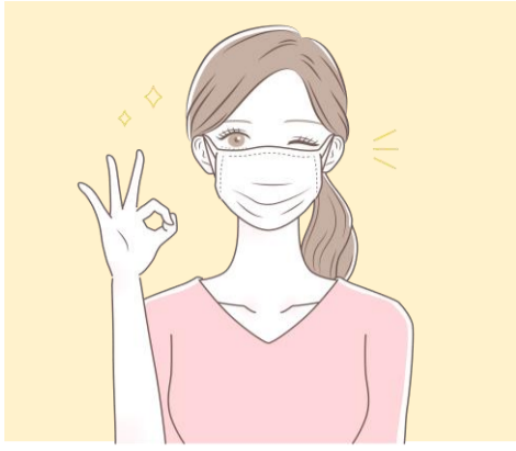
マスクは不織布が手軽ですが、シルクや綿が素材の一部に使われているタイプはよりお肌に優しく、おすすめです。