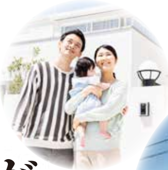
タクトホーム 公式サイト